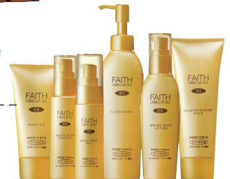
フェース ラメラモード

「フェースセラチンコラーゲン」配合の「ラメラ美容法」のスキンケアシリーズ。約1週間分のトラベルセットも好評。