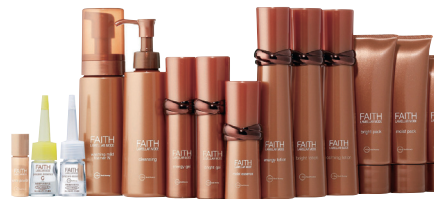
フェース ラメラパールEX

ビタミンC配糖体を内包したオリジナル成分フェース生コラーゲンを配合。溶解後は冷蔵庫で保管する。