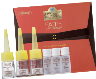
フェース ラメラモード プレケアエッセンス& ウォーターC

青い部分はナノカプセル。生コラーゲンはグリーン三重らせん構造。普通ではお肌に入らないコラーゲンを、塗るだけで角質層に浸透させることが特許です。